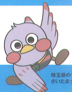
埼玉県のマスコット さいたまっち